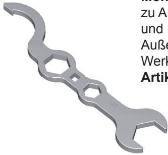
Montageschlüssel zu Anbohrarmaturen VAS/VAB und Red. Stücken mit Außenverzahnung Werkstoff - GGG Artikel-Nr.: 08.04.01