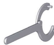
Montageschlüssel für Schraubstopfen Modell 12.07 Werkstoff - Stahl Artikel-Nr.: 08.04.07